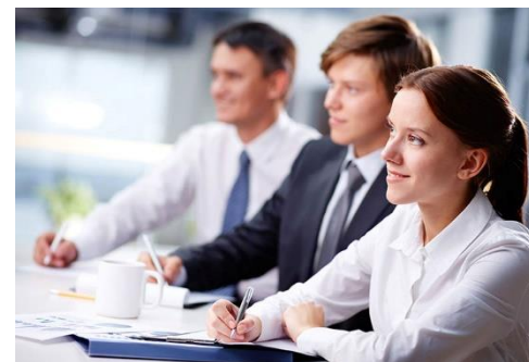
Курсы повышения квалификации