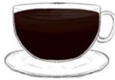
Американо 7 гр. кофе