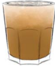
Латте 7 гр. кофе