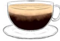
Эспрессо 7 гр. кофе