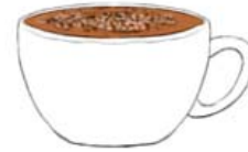
Капучино 7 гр. кофе